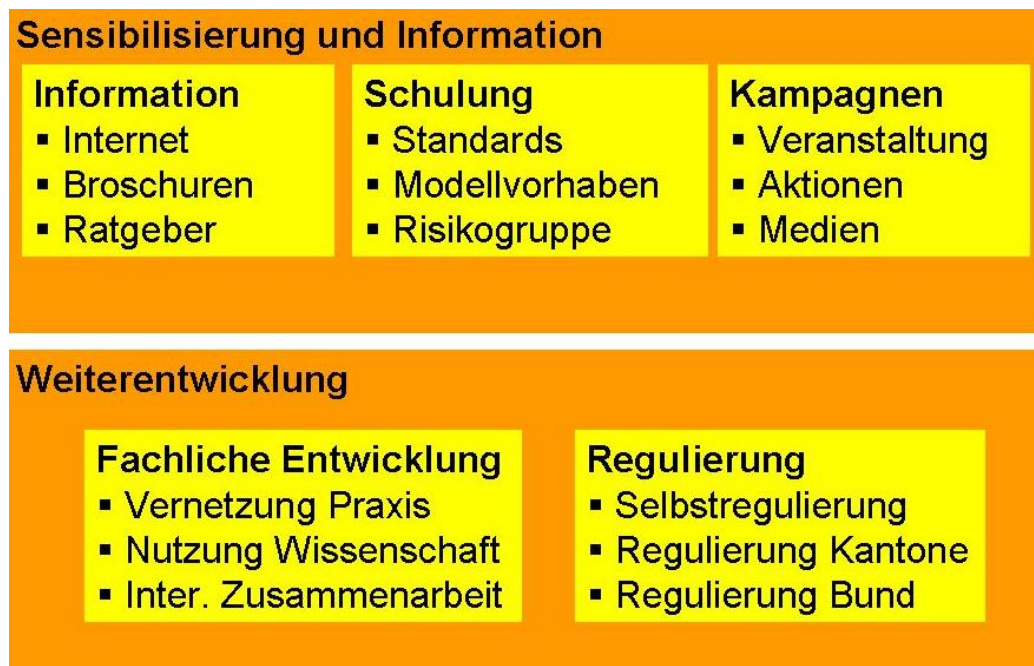
Schaubild 1: Jugendmedienschutz: Module und Massnahmen.

Das Programm hat nicht den Anspruch Massnahmen und Angebote auf allen Ebenen umzusetzen und durchzuführen. Vielmehr geht es darum, auf nationaler Ebene Kriterien, Standards und Qualitätssicherungsinstrumente zu definieren, Neues anzustossen, Lücken zu füllen und den zahlreichen Akteuren Hilfestellungen und Austauschmöglichkeiten anzubieten. Die Umsetzung von Massnahmen zur Förderung von Medienkompetenzen in der Breite soll wie bisher dezentral durch die Anbieter vor Ort erfolgen.